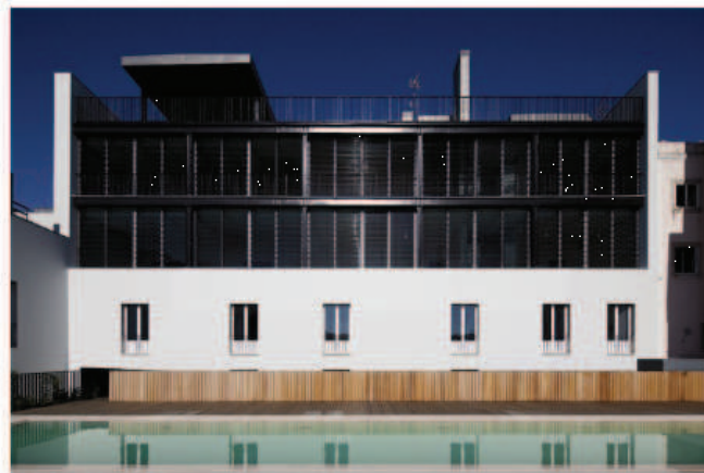
Santa Catarina Condomínio Privado D.R.